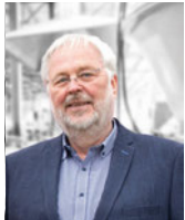
DR.-ING. UWE STEIN Fachredaktion

+49 8379 - 66 39 73 3 @ mw@extrusion-world.com