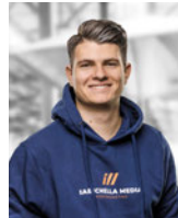
MARCO IABICHELLA Videoproduktion